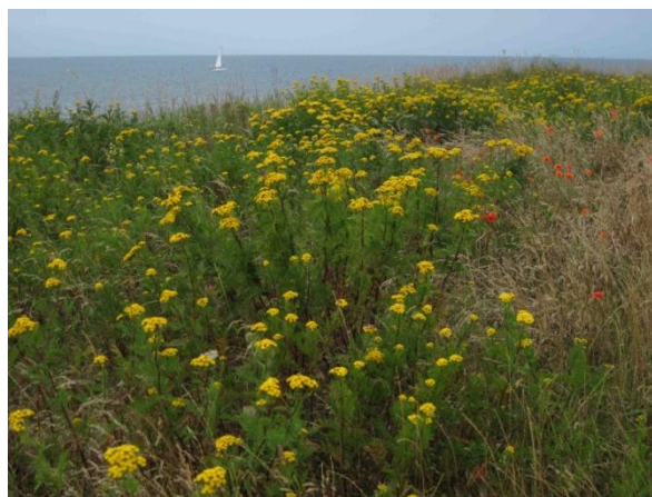
Fattoria in Fionia e prati fioriti a picco sul mare sull'isola di Langeland