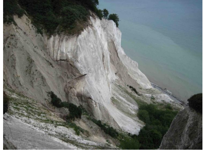
Le falesie di Mon's klint

Lunedì 2 agosto partiamo subito per Copenhagen arrivando in meno di un'ora, anche se la difficoltà è trovare l'uscita autostradale giusta per raggiungere l'AA City Camp, dove giungiamo alle 10. Vedendo alcuni camper in sosta fuori, pensiamo che l'area sia già al completo, ma appena mi avvicino al gestore per chiedere, mi risponde in italiano che "è possibile". In breve ci illustra il costo (30 € a notte, con possibilità di restare fino alle 20 del giorno dopo), ci consegna alcune mappe della città, spiegandoci la possibilità di prendere il battello poco lontano oppure di utilizzare le piste ciclabili. Come colpo d'occhio l'area non è bella, è situata vicino a strade di grande traffico e a qualche fabbrica, i camper sono inoltre molto vicini e non c'è verde, ma è comodissima per il centro, ha tutti i servizi funzionali ed è ottima per noi che non intendiamo certo rimanere seduti davanti al camper. Come prima mattina decidiamo di fare il giro della città in battello, che parte proprio dal centro commerciale Fiskertorvet adiacente l'AA. È molto suggestivo avere una panoramica della città dai suoi canali e si vedono già alcuni dei suoi monumenti.