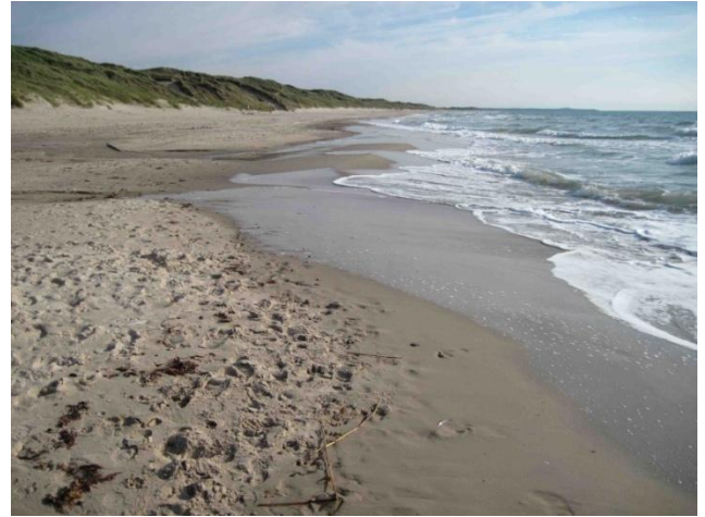
Faro e spiaggia di Hirtshals