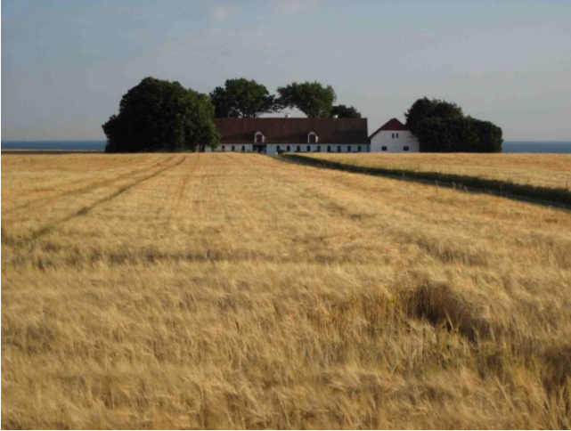
Campi di grano a picco sul mare

decidiamo di rimanere lì a dormire in un tranquillo parcheggio sui viali d'accesso insieme ad altri 3 camper. Questa tappa ci serve per arrivare a Copenhagen domattina presto. Km 157.